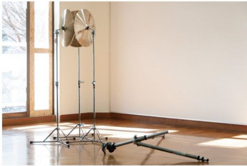
上野悠河 <2と3> 2021