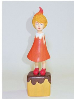
関口恵美 <紙橋娘No.11> 2022