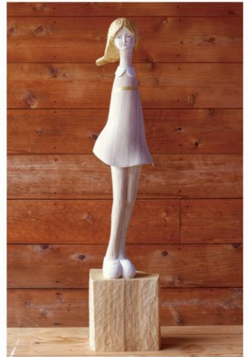
関口恵美 <一輪の花うた> 2021