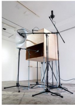
上野悠河 <時に、乱そうとする> 2021