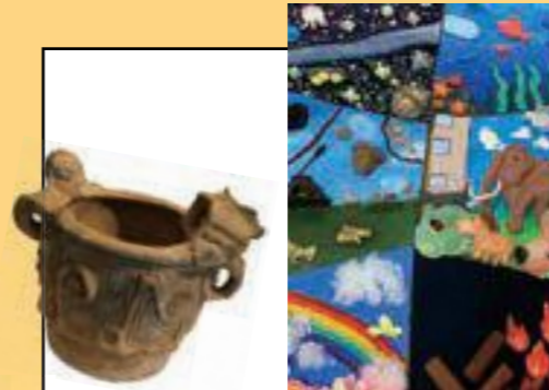
海神中学校 Kaijin Junior High School

ジャンル：立体インスタレーション 展示場所：2F 脳やサンゴや情報の成長、生命と知の形態の探究から、縄文土器の構造に自然界の底流を感じ、表現しました。