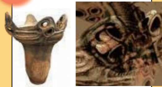
大内公公 OHUCHI Hamham

ジャンル：平面 展示場所：2F 縄文土器に刻まれた無数の線は、からまり、ほどけ、渦を巻く。縄文の線が放つエネルギーを表現する。