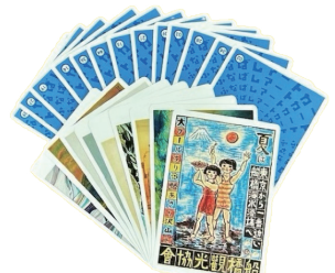
ふなばしアートカード