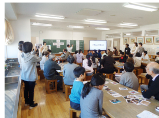
対話型鑑賞教室の様子

（公財）船橋市公園協会が実施している市立小学校5年生を対象とした図画工作科の出前授業。「ふなばしアートカード」を教材としたアクティビティを行うことで、子供たちが主体的にアートに関わり、心豊かに成長するとともに、生涯にわたり鑑賞や創作活動に参加する素地を育むことを目的としています。