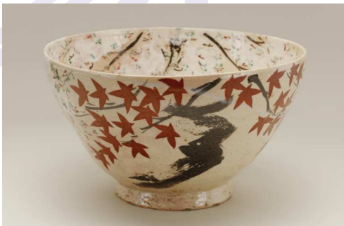
北大路魯山人《色絵雲錦大鉢》制作年不詳