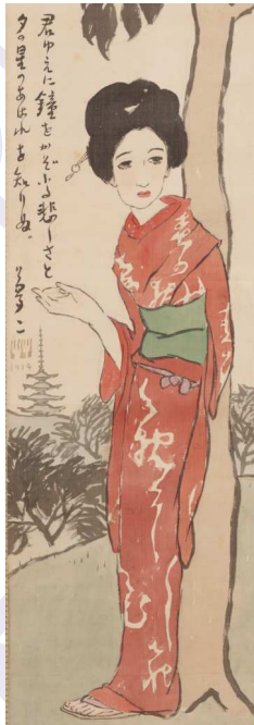
竹久夢二《若ゆえに》（1911年大正3）年