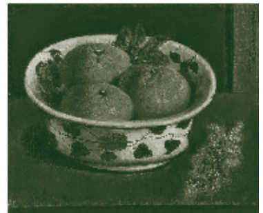
椿貞雄《静物》昭和31年（32年加筆）